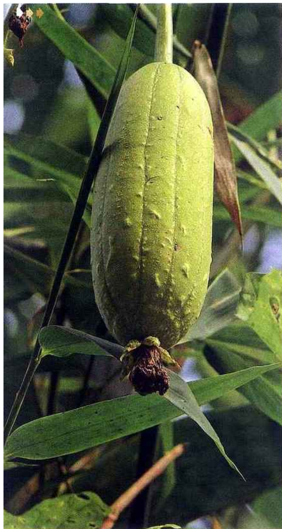
Une fois séchées, les fibres de cette courge exotique produisent une éponge végétale parfaite pour éliminer les cellules mortes et affiner le grain de peau.